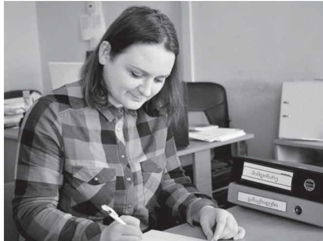
ბათუმის ბაზრის ახალგაზრდა მოთხოვნილი პროფესიონალი

ახალგაზრდა მეცნიერთა კავშირი „ინტელექტი“ ახორციელებს პროექტს „მიგრანტთა მდგომარეობის გაუმჯობესება აჭარაში“, რომლის მიზანია აჭარის რეგიონში დაბრუნებული პოტენციური ეკონომიკისტებისა და შრომითი მიგრანტებისათვის გრძელვადიანი პერსპექტივაზე გათვლილი ცხოვრების ღირსეული პირობების ჩამოყალიბების ხელშეწყობა, მიგრაციისა და განვითარების საკითხების დაკავშირება და მიგრანტთა ჩართულობის დონის ამაღლება რეგიონის ეკონომიკური განვითარების პროცესებში. პროექტის ფარგლებში ერთ-ერთ ძირითად აქტივობად გათვალისწინებულია ქ. ბათუმში, ხელვაჩაურისა და ქობულეთის მუნიციპალიტეტებში მცხოვრებ შრომით და ეკოლოგიურ მიგრანტთა პროფესიული სწავლების ხელშეწყობა. ეკოლოგიურ და შრომითი მიგრანტებს შეუძლიათ ჩართონ აღნიშნულ პროექტში, მიიღონ სასწავლო გრანტი და შეისწავლონ სასურველი პროფესია პროფესიული კოლეჯ „ბლექსი“ (ქ. ბათუმში) და საზოგადოებრივ კოლეჯ „ახალ ტალღაში“ (ქობულეთში). პროექტის ფარგლებში პროფესიული მომზადებას გაივლის მინიმუმ 100 ეკოლოგიური და შრომითი მიგრანტი, მათ შორის 50% იქნება ქალი.